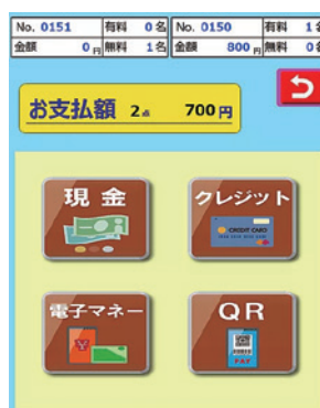
支払方法 選択画面